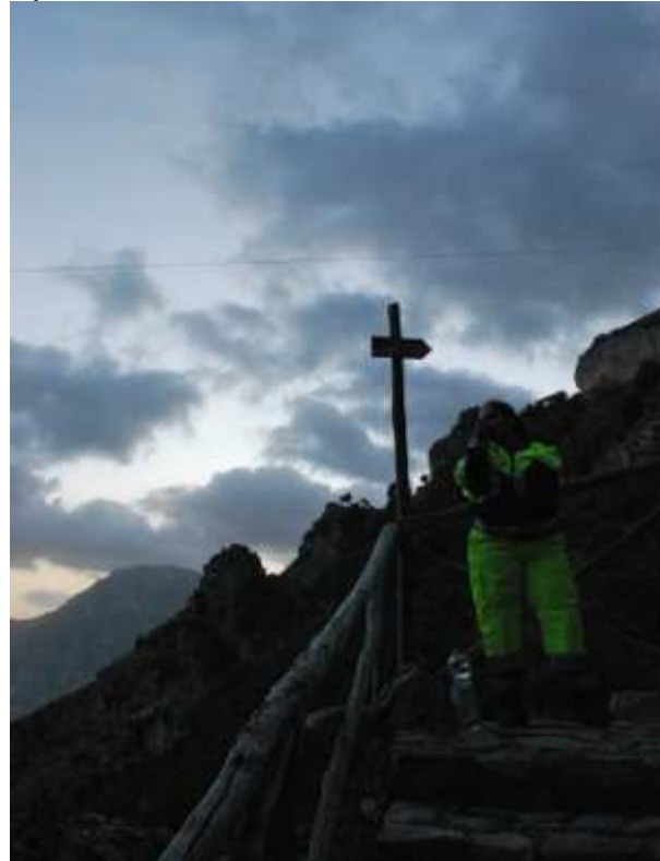
Il soccorso presso la salita

E così, una composizione dietro l'altra, prendendo spunti dai suoi vari album, da Eden Roc a Divenire , ha entusiasmato il pubblico che è stato per quasi due ore in religioso silenzio.