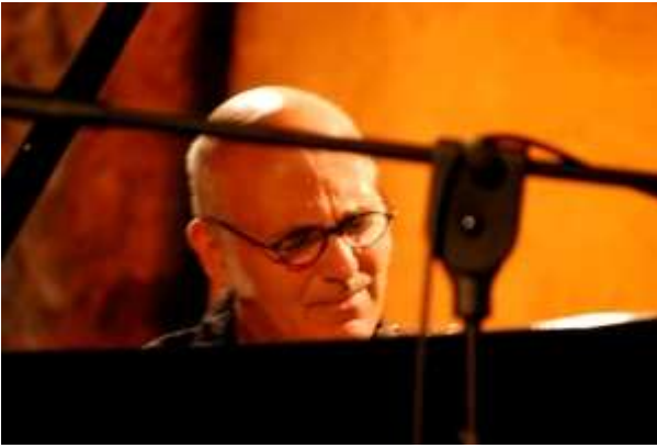
Ludovico Einaudi.