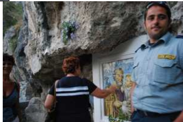
La devozione dinanzi San Giuseppe